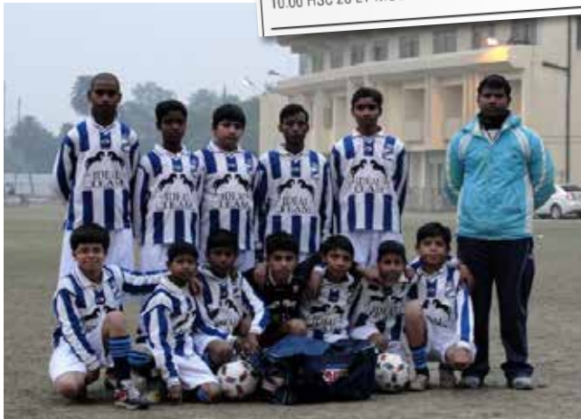
M.O.C. '17-shirts voor Suriname en India

10.15 MOC E6-DVO'60 E4 10.15 MOC E7-VVV'67 E2 09.30 VVC'68 E2-MOC E8 10.15 SC Welberg E2-MOC E9 09.00 Halsteren E5-MOC E10 08.45 MOC E11-Sprundel E4 09.00 Kogelvangers E3-MOC E12 08.45 MOC F1-TSC F1 10.00 Virtus F1-MOC F2 10.15 Halsteren F3-MOC F3 08.45 MOC F4-DVO'60 F3 09.30 VVC'68 F1-MOC F5 08.45 MOC F6-Meto F4 09.30 Smerdiek F1-MOC F7 08.45 MOC F8-Meto F3 11.00 BSC F4-MOC F9 08.45 MOC F10-NVS F2 08.45 MOC F11-Lepelstr.Boys F1 13.00 TEC G1-MOC G2 11.00 Rijen JG1-MOC JG1 13.15 MOC MB1-Moerse Boys MB1 11.45 MOC MC1-Virtus MC1 11.45 MOC MD1-Cluzona MD1 08.45 MOC ME1-Gloria UC ME1 11.00 FC Dauwendaele ME1-MOC ME2 Donderdag 27 maart 20.00 MOC VE1-Vosmeer VE1 20.00 MOC VE2-Dosko VE1 20.30 Halsteren VE2-MOC VE3 Voor veranderingen en uitslagen: www.MOC17.nl